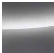
Gris Indio Metalizado