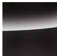
Deep Black Efecto Perla